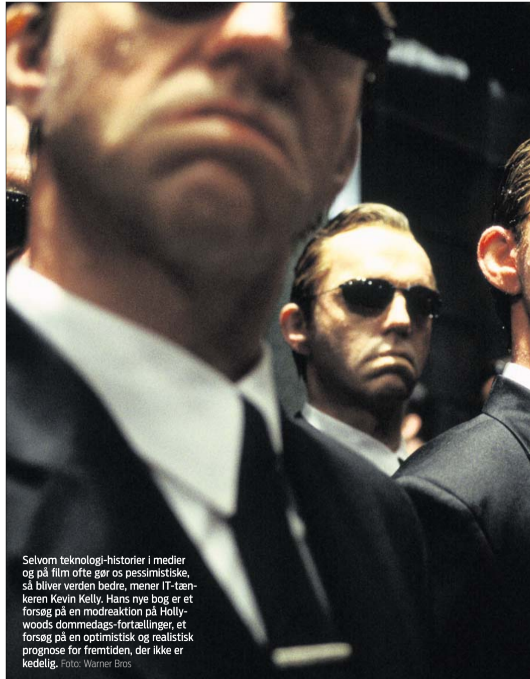
Selvom teknologi-historier i medier og på film ofte gør os pessimistiske, så bliver verden bedre, mener IT-tænkere Kevin Kelly. Hans nye bog er et forsøg på en modreaktion på Hollywoods dommedags-fortællinger, et forsøg på en optimistisk og realistisk prognose for fremtiden, der ikke er kedelig.

»Jeg er ikke en utopist, der tror, at der er en destination med teknologien, som vi bevæger os i retning af, hvor vi til sidst er i harmoni i vores liv og samfundet. At alt er godt. Jeg er heller ikke dystopist, som er "Hollywood-versionen", hvor alt kollapse: Teknologien overtager og dræber os. I stedet er jeg optimistisk, fordi jeg tror, at verden bliver bedre år for år. Ikke meget bedre. Måske kun en pct. Men hvis vi skaber en pct mere, end vi ødelægger hvert år, så er den ene pct sammenlagt år for år det, som civilisationer skabes af. Hvis du ser tilbage på de seneste 20 eller 200 år, vil du se, at vi faktisk forbedrer vilkårene for alt det, som mennesker går op i. For 30 år siden ville det for eksempel være en langt sværere og mere intellektuelt krævende opgave at forestille sig nutidens verden, end det ville være at fore-